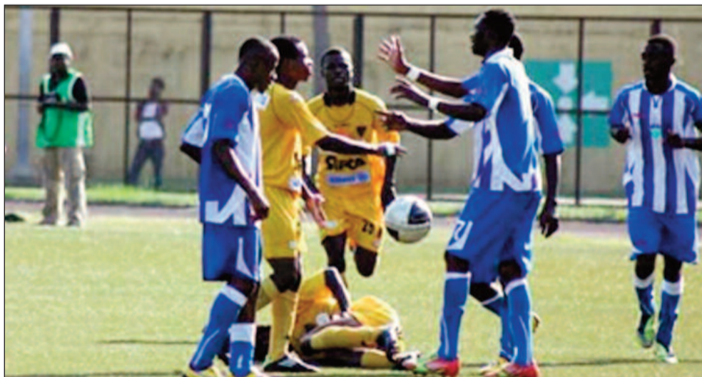
La bataille s'annonce chaude.

Le match en retard de la 14 ème journée de la Ligue 1 de football opposant le Séwé Sport à l'Asec Mimosas se joue cet après-midi (16h 00) au stade de San Pedro. L'objectif pour les Mimos est de récupérer la tête du classement après le nul (0-0) enregistré hier par Gagnoa et