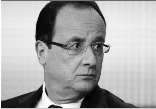
François Hollande, chef de l'Etat français.