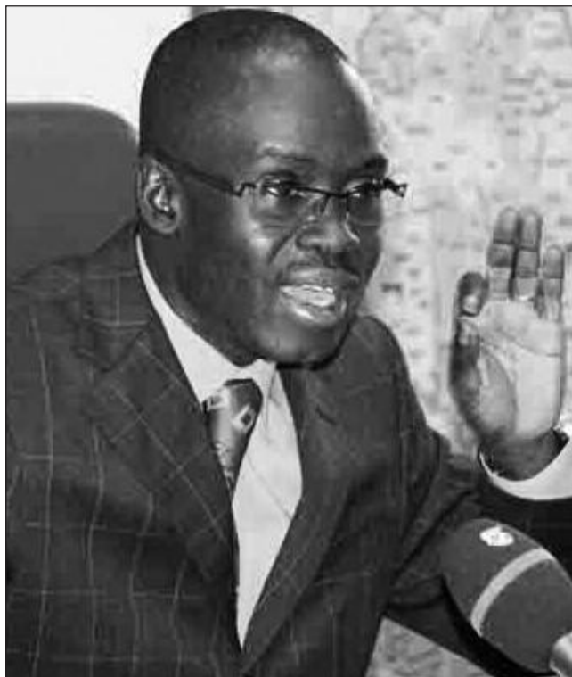
«Le président Gbagbo n'est pas un chef de tribu...».