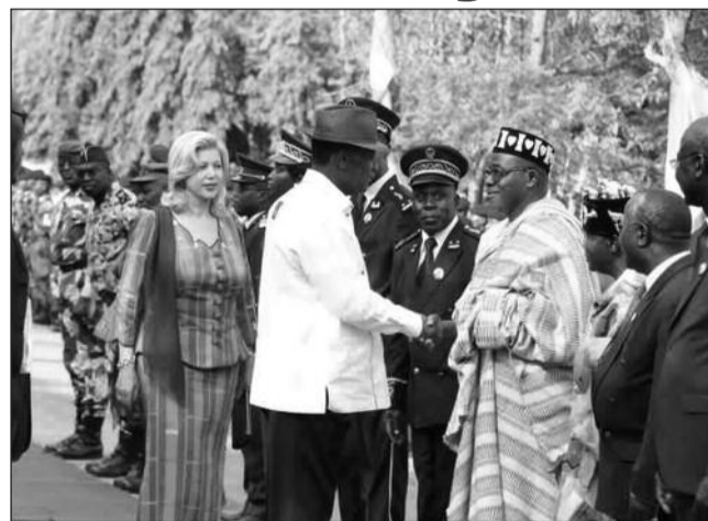
Le chef de l'Etat, Alassane Ouattara.

Cela ne veut pas dire que ces localités au pays Akyé et les populations n'ont pas de besoins. Que ce soit à Yakassé, Adzopé et Akoupé, les