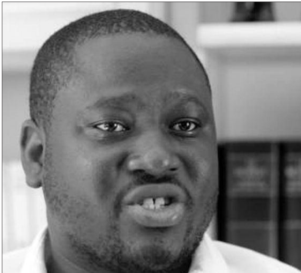
Les adversaires internes de Soro au Rdr sont décidés à lui barrer le chemin. (Photo d'archives)

Les militants du Rhdp sont conviés à l'investiture de leur candidat, Alassane Dramane Ouattara, ce samedi, au stade Félix Houphouët-Boigny d'Abidjan-Plateau. Mais ce qu'ils ne savent pas, c'est qu'une véritable guerre oppose en ce moment les partisans de l'actuel chef de l'Etat à ceux du président de l'Assemblée nationale, Guillaume Soro, pour le contrôle de la manifestation. En effet, selon des sources proches du comité d'organisation de la cérémonie de samedi, le chef du parlement, qui ne fait plus mystère de sa volonté de prendre la direction de la campagne de son mentor et, plus tard, celle du RDR, le parti au pouvoir, serait à la manœuvre pour convoyer le maximum de ses partisans au stade Houphouët-Boigny pour se faire applaudir. Histoire de montrer qu'il est le choix de la base du parti à la case pour diriger la campagne de Ouattara. «Soro veut faire convoyer tous ses clubs de soutien pour se faire applaudir. C'est le même scénario qu'il a utilisé au dernier congrès extraordinaire. Mais, cette fois, ça ne passera pas», confiait, en début de semaine, un membre du comité d'organisation de la convention du Rhdp, parti-