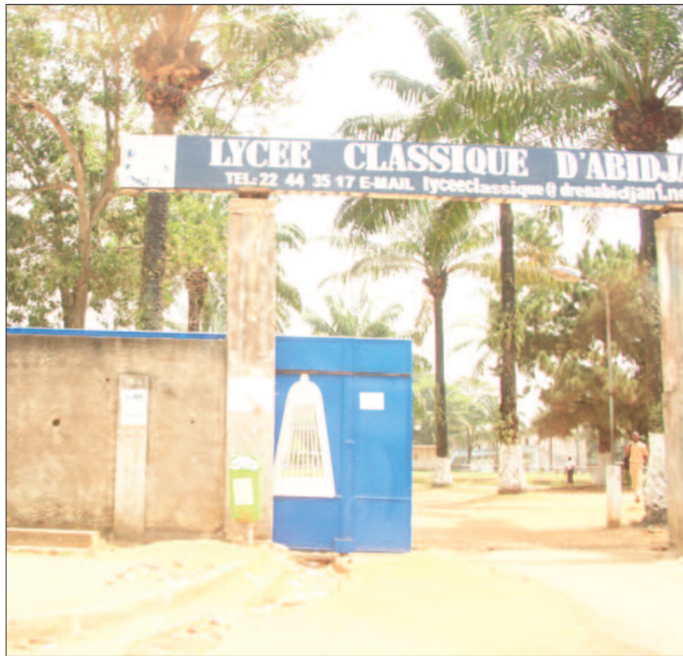
La grève des enseignants se durcit.

Le Collectif des syndicats du secteur éducation/formation,