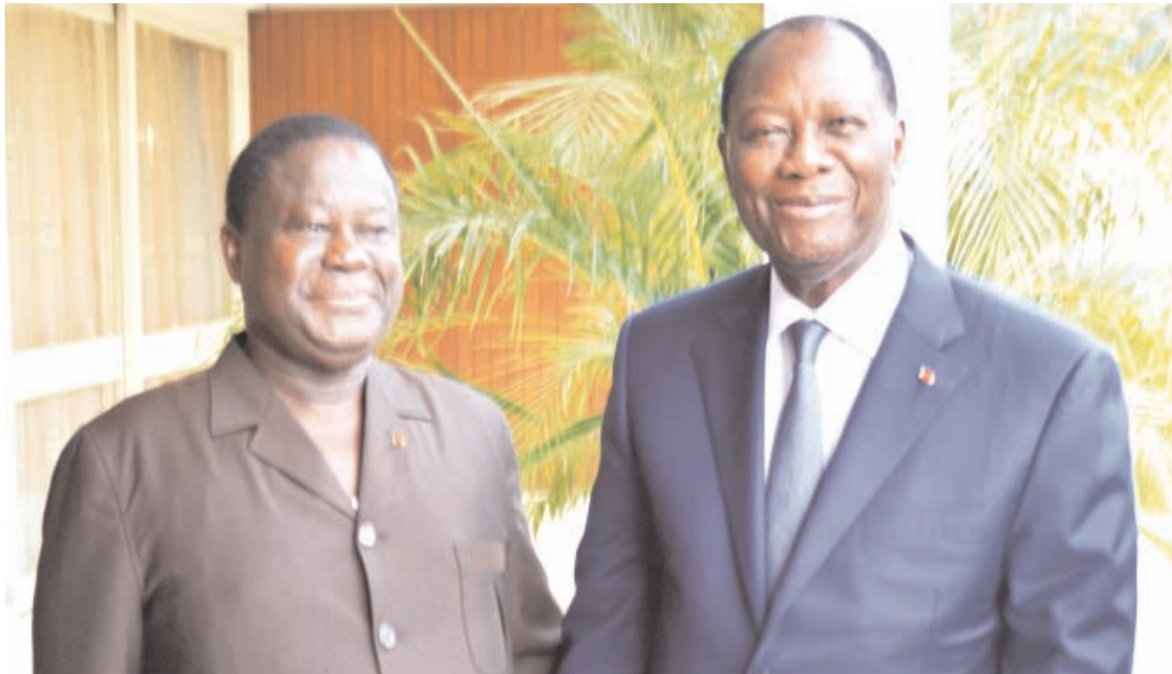
Le chef de l'Etat était hier à la résidence de Bédié à Cocody.

En prélude à la grand-messe de l'alliance des houpouëtistes pour la paix, le président de la République, Alassane Ouattara, a rendu une visite de courtoisie et d'amitié au président Henri Konan Bédié à Cocody, hier après-midi. Après une demi-heure de tête-à-tête, le chef de l'Etat a indiqué que, comme à l'accoutumée, il est venu saluer son aîné et faire avec lui le tour d'horizon de l'actualité nationale, notamment les questions sécuritaires, sociales et économiques. A l'occasion de cette visite, Alassane Ouattara a remercié Bédié pour l'appel lancé à Daoukro. « Comme vous le savez, il a décidé que le samedi 25 avril au stade Félix Houphouët-Boigny, il y aura l'investiture du candidat unique du RHDP. Avant donc la convention de samedi, je suis venu dire merci au président Bédié, d'abord pour l'Appel de Daoukro et tout ce qu'il a fait pour matérialiser cette décision. Mais aussi dire que c'est la voie de l'évolution de la Côte d'Ivoire à moyen et long termes dans la modernité et la stabilité » a indiqué, le chef de l'Etat, Alassane Ouattara.