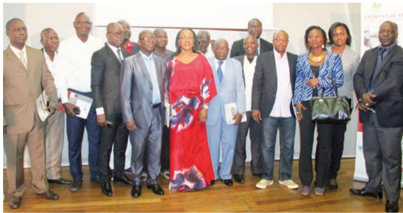
La photo de famille sanctionnant la rencontre entre les Directeurs de Publication et le Secrétaire exécutif du CCESP.

sidé par le Premier ministre, organise la concertation entre l'Etat et le secteur privé en vue d'instaurer une confiance mutuelle entre les deux parties et favorise la consultation a priori sur toute décision importante du gouvernement. Le suivi de l'application des mesures adoptées, l'arbitrage des conflits d'intérêts entre l'Etat et le secteur privé ainsi que l'examen du climat des affaires font également partie de ses attributions. « Nous avons un pouvoir d'organisation et d'influence », a souligné