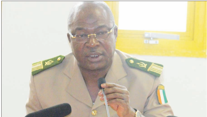
Le Colonel-Major Issa Coulibaly s'est engagé à réaliser l'objectif de recettes du deuxième trimestre.

Bilan positif pour l'administration douanière au premier trimestre 2015. Sur un objectif de 370,1 milliards de FCFA, les douanes ivoiriennes ont réalisé une recette de 391,6 milliards de FCFA à fin mars 2015. Soit une plus-value de 21,5 milliards de FCFA et un taux de réalisation de 105,8%. Le directeur général des douanes, le Colonel-Major Issa Coulibaly, a partagé hier cette bonne nouvelle avec la presse autour d'un déjeuner à la Maison de l'Entreprise au Plateau. Une performance que le premier responsable des douanes ivoiriennes met sur le compte de plusieurs facteurs. Notamment, la baisse des cours du pétrole qui a entraîné, selon lui, une évolution favorable de la taxation des produits raffinés, à savoir le gasoil et le super. L'ouverture des bureaux frontières