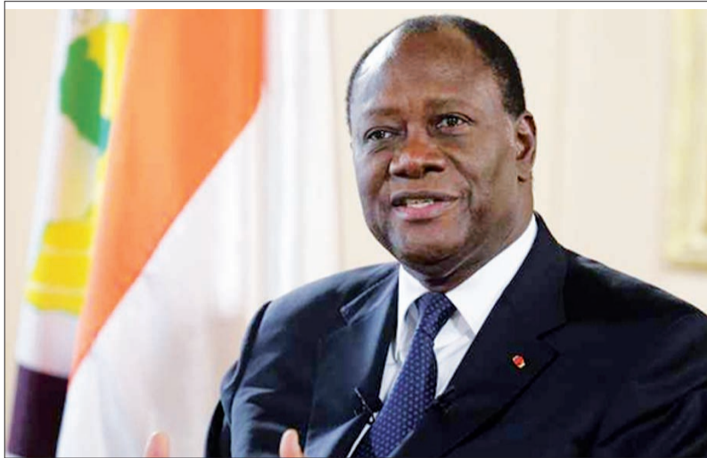
Les bonnes nouvelles du Président Ouattara vont guérir les travailleurs de Côte d'Ivoire

L'attente a été certes longue, mais l'engagement pris par le Président de la République, Alassane Ouattara, sera tenu dans quelques jours. Le déblocage des avancements indiciaires des fonctionnaires et agents de l'Etat de Côte d'Ivoire est effectif. Si l'on s'en tient aux indiscrétions émanant des autorités financières ivoiriennes, les bénéficiaires verront leur solde augmenter à la fin du mois de mai 2015. Les choses sont désormais claires. Le traitement administratif des dossiers qui relevait de la compétence du ministère de la Fonction publique et de la réforme administrative est désormais bouclé. Ainsi que le traitement des fichiers techniques par la direction générale de la Solde. Au niveau du croisement des fichiers, le problème des doublons a été corrigé. En effet, il a été constaté que certains fonctionnaires qui ont été déblocqués en 2014 se retrouvaient encore sur les fichiers de 2015. Au moment où nous mettons sous presse, tout est fin prêt pour