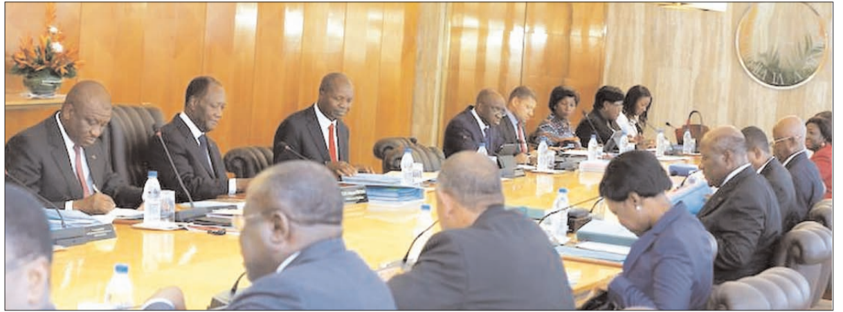
Le gouvernement veut assainir le secteur du transport

de la professionnalisation du métier de transporteur, indiquant que cette mesure vise à mettre de l'ordre dans ce secteur. « Au titre du ministère de Transport et en liaison avec d'autres ministères, deux décrets ont été pris. Le premier portant accès à la profession de transporteur et à l'exercice d'activité de transport routier », a affirmé le porte-parole du gouvernement, Bruno Nabagné Koné, également