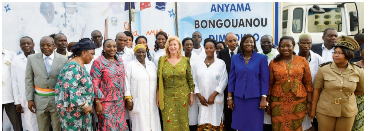
Madame Dominique Ouattara a procédé au lancement de la 3ème édition de la caravane ophtalmologique de la Fondation Children Of Africa.

offertes aux enfants chez qui une faible acuité visuelle sera diagnostiquée. Les cas graves seront entièrement pris en charge par la Fondation Children of Africa. Ils peuvent aller jusqu'à une intervention chirurgicale pour sauver les enfants. C'est l'esplanade du groupe scolaire le Plateau qui servi de cadre aux festivités de ce lancement. Pour l'occasion, la Fondation Children of Africa a célébré la santé avec les tout-petits. Artistes en vogue mais aussi, des jeux et des clowns ont été de la partie pour marquer l'importance de cet évènement. Et comme elle sait si bien le faire, madame Dominique Ouattara n'a pas effectué le déplacement d'Anyama les mains vides. En effet, la fondatrice de Children of Africa a offert des dons en nature d'une valeur de 14 millions F CFA. Ce sont des équipements pour les écoles